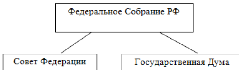
Рисунок 1 - Структура парламента Российской Федерации

В названиях рисунков, состоящих из нескольких строк, не должно быть переносов (межстрочный интервал – 1,5), не допускается подчеркивание, использование курсива и жирного шрифта. В качестве иллюстраций могут выступать диаграммы, схемы, карты, картосхемы, графики и др. Однако все указанные виды графического (иллюстративного) материала по тексту обозначаются как рисунки.