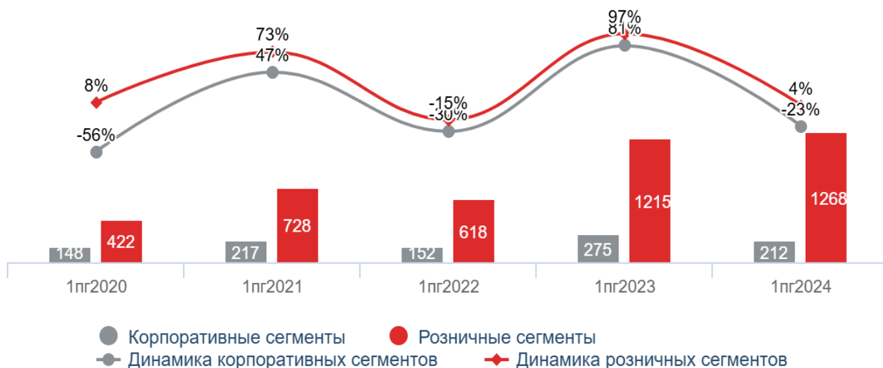
Рисунок 1 — Динамика объема рынка лизинговых услуг за 1 полугодие 2020-2024 годы, млрд. руб.

Если рассматривать ситуацию с лизинговыми услугами в 2024 году, то за первое полугодие 2024 года рынок незначительно снизился по сравнению с тем же периодом прошлого года [5]. Более подробную динамику данного рынка мы можем видеть на рисунке 1 [4].