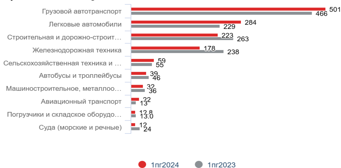
Рисунок 2 — Результаты топ-10 сегментов рынка лизинговых услуг, млрд. руб.

Несмотря на сохранение положительных темпов роста в сегменте лизинга грузовых и легковых машин, их динамика существенно ослабла по сравнению с резким подъёмом 2023 года, вызванным постоянным увеличением цен на автомобили и повышением размеров лизинговых выплат вследствие роста процентных ставок в экономике. Одновременно с этим доля автолизинга в структуре общего объёма нового бизнеса уверенно растёт уже пятый год подряд: по результатам первой половины 2024 года она поднялась до 56% по сравнению с 50% за аналогичный период предыдущего года [4]. Далее на рисунке 2 рассмотрим результаты 10 наиболее популярных сегментов лизинга за первое полугодие 2024 года [4].