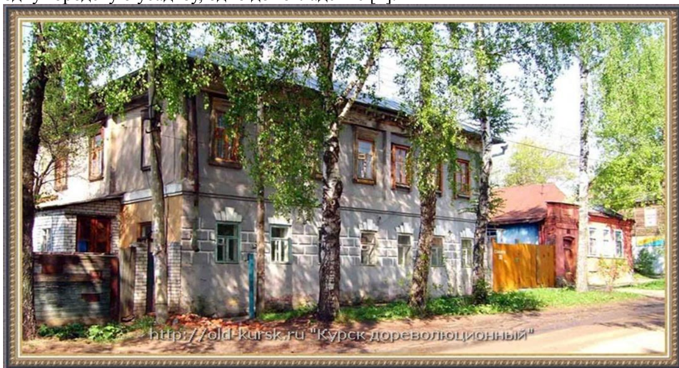
Рисунок – 1. Усадьба М.В. Пузанова (дома № 30 и 30-а по ул. К. Либкнехта)

Дома № 30 и 30-а по улице Карла Либкнехта в Курске в старину составляли одну городскую усадьбу, одно домовладение [1].